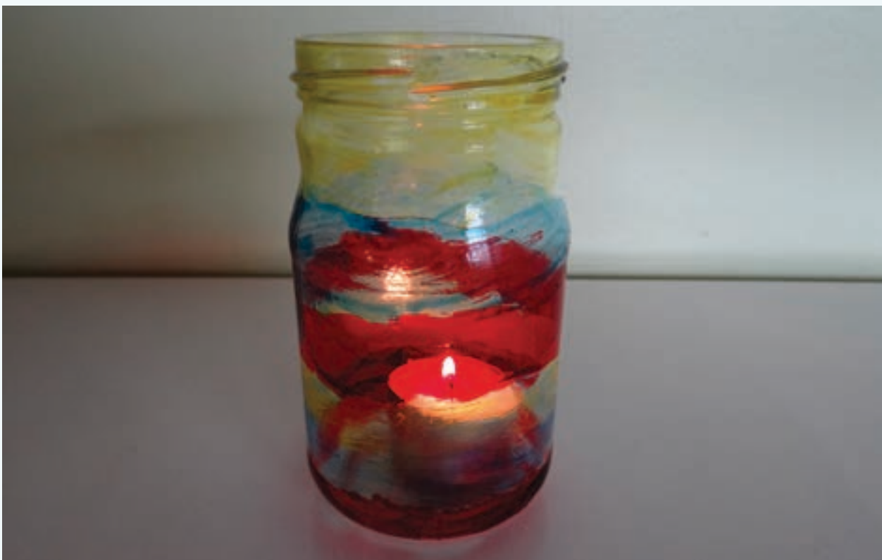
Pripremila Maja Masnjak Pejić

Učenici su na sat donijeli čaše glatkih stijenki ili manje staklenke dovoljno velike da u njih stane lučica. Svaki će učenik stvoriti i oslikati vlastiti svijećnjak. U jednom dijelu učionice organizira se likovni kutak. Klupe se spoje kako bi istodobno moglo raditi nekoliko učenika. Troje ili četvero njih kistom oslikava svoje čaše ili staklenke bojama za staklo. Ostali učenici za to vrijeme mogu gledati animirani film ili čitati. Izmjenjuju se u likovnom kutku dokle god svi ne oslikaju svoje svijećnjake. Svijećnjaci se tijekom noći moraju osušiti. Sutradan se mogu izložiti na nekome prigodnom mjestu u učionici. Lučice se mogu upaliti, a to će svaku učionicu ispuniti posebnom toplinom i blagdanskim ozračjem.